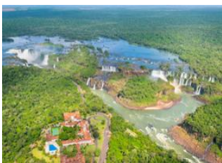
Foz do Iguazu 📍