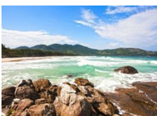
Foz do Iguaçu 📍