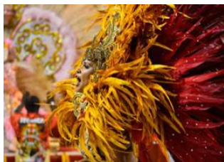
Rio de Janeiro 📍