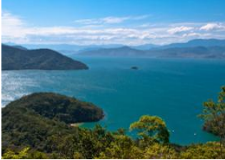
Ilha Grande 📍