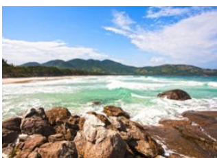
Foz do Iguazu 📍