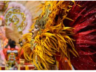
Rio de Janeiro