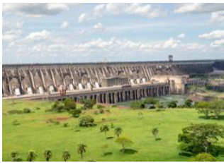
Foz do Iguazu 📍