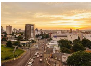
Rio de Janeiro 📍 ✈ - ⌚ 2h Foz do Iguaçu 📍