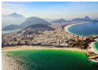
Rio de Janeiro 📍