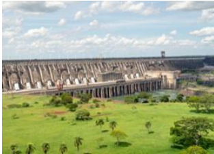
Foz do Iguaçu 📍