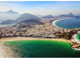
Rio de Janeiro