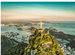
Rio de Janeiro 📍