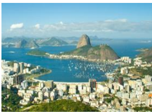
Rio de Janeiro 📍