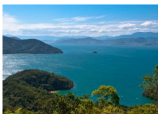
Ilha Grande 📍