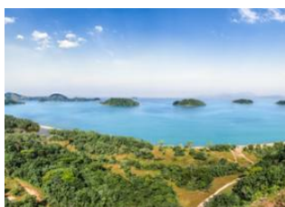
Foz do Iguaçu 📍