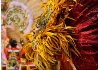
Rio de Janeiro 📍