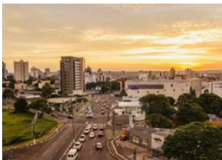
Rio de Janeiro 📍 ✈️ - ⌚ 2h Foz do Iguaçu 📍