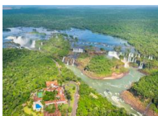
Foz do Iguaçu 📍