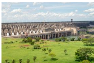
Foz do Iguaçu 📍