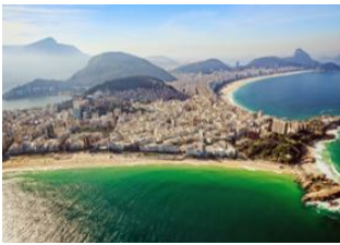
Rio de Janeiro 📍