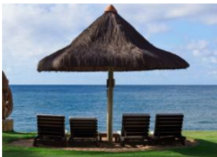
Praia do Forte 📍