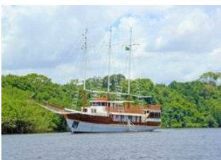
Manaus 📍 🚣 Amazonie 📍