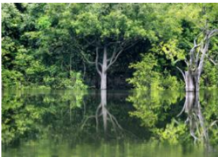
Rio de Janeiro 📍 ✈️ - 🕒 4h Manaus 📍