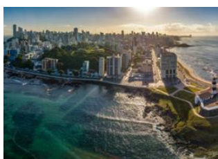
Praia do Forte 📍