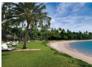
Praia do Forte 📍