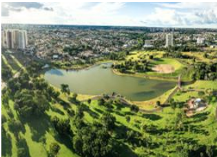
Rio de Janeiro 📍