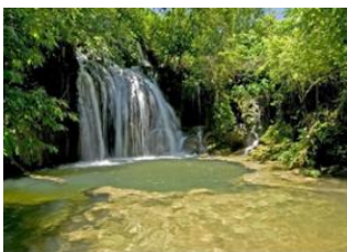
Fazenda Pantanal 📍 🚗 178km Bonito 📍