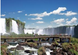
Foz do Iguacu