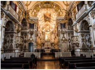
Rio de Janeiro 📍