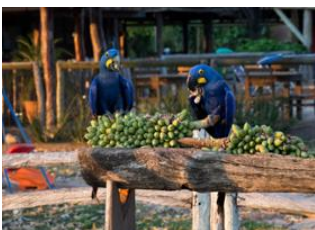
Campo Grande 📍