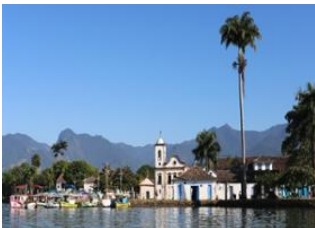
Foz do Iguacu