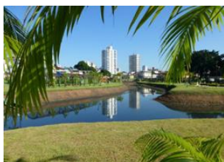
Rio de Janeiro 📍 ✈ - ⌚ 4h Manaus 📍