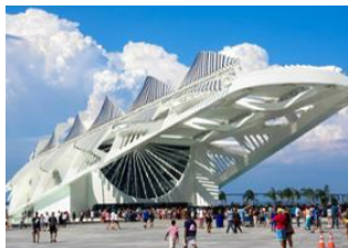
Rio de Janeiro 📍