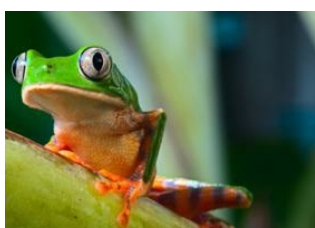
Manaus 📍 🚗 - ⌚ 3h Amazonie 📍