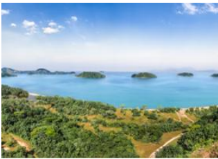
Foz do Iguaçu 📍