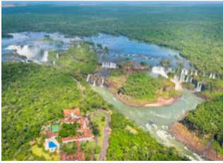
Foz do Iguaçu 📍