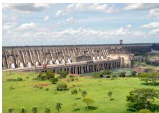
Foz do Iguaçu