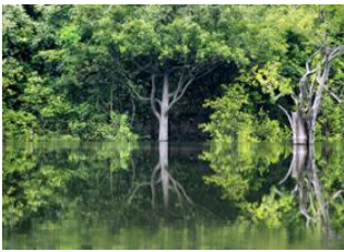
Rio de Janeiro ✈ - ⌚ 4h Manaus