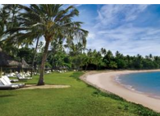
Praia do Forte 📍