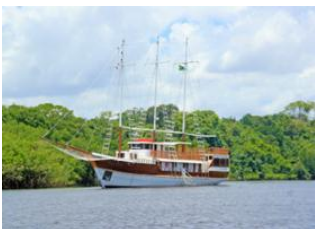
Manaus 🚢 Amazonie