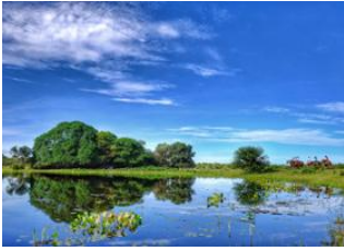
Fazenda Pantanal 📍