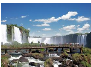
Foz do Iguazu