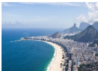
Rio de Janeiro 📍