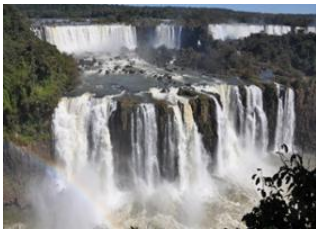
Foz do Iguazu