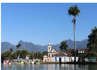
Foz do Iguazu