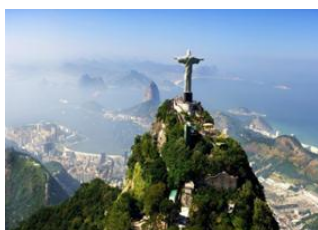
Rio de Janeiro 📍