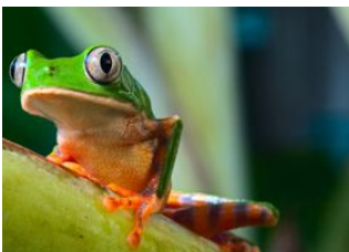
Manaus 🚗 - ⌚ 3h Amazonie