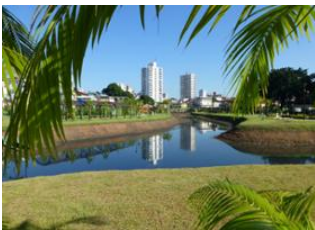
Rio de Janeiro ✈ - ⌚ 4h Manaus