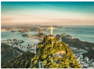
Rio de Janeiro 📍