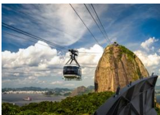
Rio de Janeiro 📍