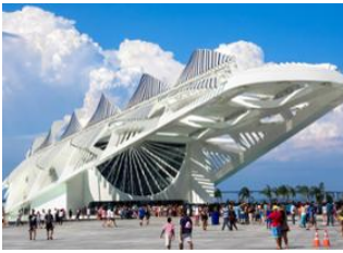
Rio de Janeiro